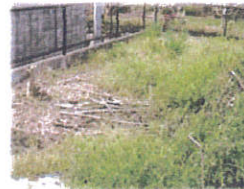
空地部分 もったいないかな?