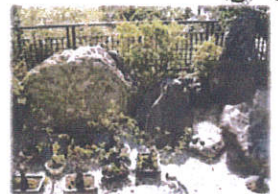
お庭部分 日本的ですよ...