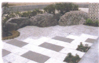
お庭部分 慰み入れのある石も利用して...