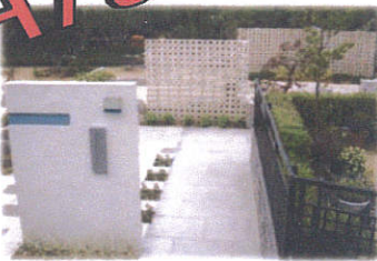
アプローチ部分 ゆったりとしたスロープのアプローチ 温かい家族が待つ場所へ続きます...