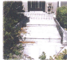
アプローチ部分 決して悪くはないですよ...