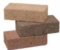
エニソ《ユニブロック》