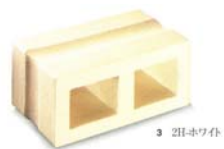
名古屋サウ工業《空洞ブロック》