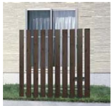
三協立山アルミ《アクセティア1型》